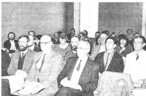
Entreprises ayant des salariés Secteur privé

Les prospectives ont généralement pour effet de stimuler les débats. L'analyse de M. Maurice Bellard conseiller de synthèse du SUAD a suscité bien des questions. En tenant compte d'un rythme de 4 à 5 installations par an, le technicien tentait en prolongeant la tendance actuelle de supputer ce que serait le canton de Lassay dans les dix ou vingt années qui viennent. Actuellement, on dénombre 342 exploitations avec une surface moyenne de 26 ha. En 1995, il n'en restera plus que 248 avec une surface moyenne de 36 ha et en 2005,