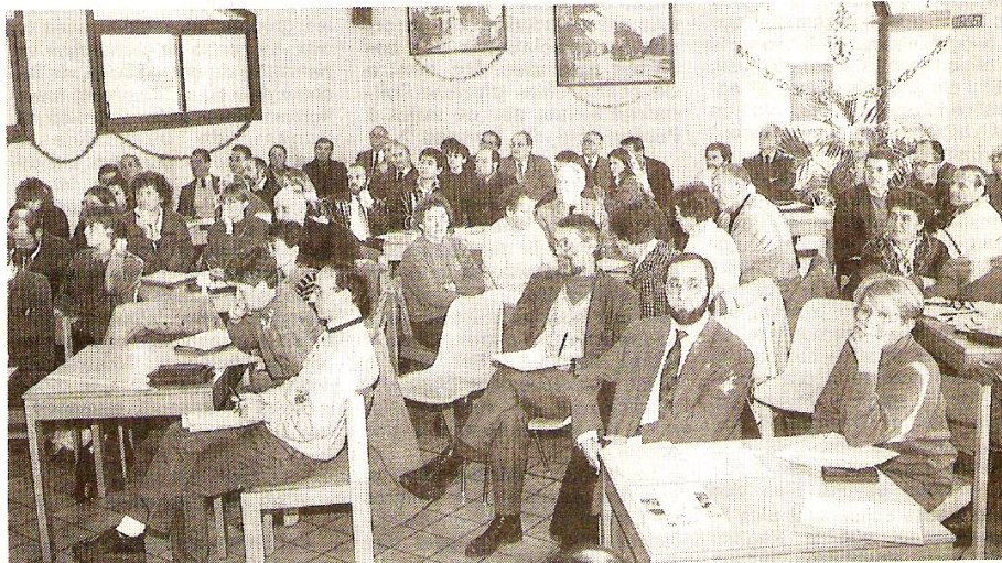
Une petite centaine de personnes pour parler de démocratie locale.