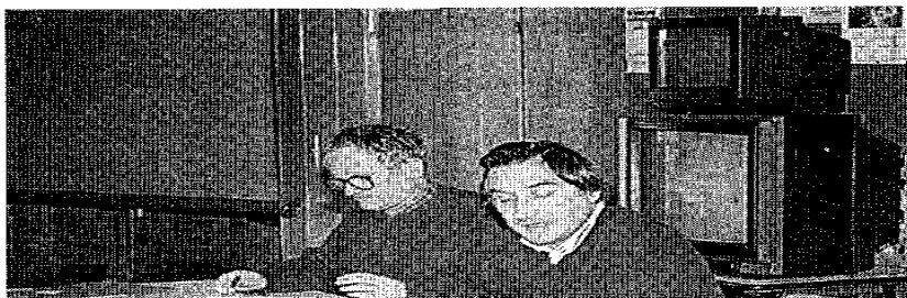
Avenir agricole, 4 décembre 1992 (titre et chapeau)