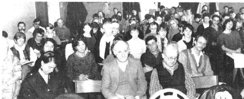
Une centaine de participants : des travailleurs sociaux et des membres d'associations intermédiaires.

de son action de 1988, mais aussi il a consacré une journée entière au problème. Vendredi, au centre socioculturel des Pommerais, à Laval, une centaine de personnes, des travailleurs sociaux essentiellement, ont planché sur le thème : « Chômage et traitement social du chômage en Mayenne ».